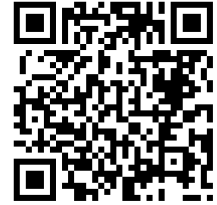
桃園市公立及非營利幼兒園 招生網